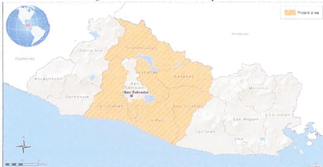
Figura 2: Área de Influencia del Proyecto

Buscando impactos notables en el ámbito territorial, el área del Proyecto consiste de regiones/zonas y municipios prioritarios de mayor potencial para la intensificación/ diversificación de la producción a la vez que aquellas áreas con la mayor concentración de los grupos-objetivo del Proyecto.